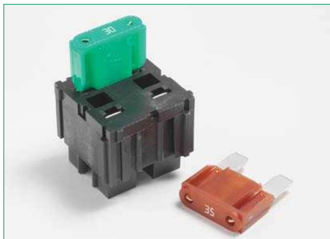
Dimensions in mm / Maße in mm